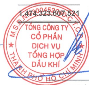
Phùng Tuấn Hà Chủ tịch Hội đồng Quản trị Ngày 27 tháng 3 năm 2026

Các thuyết minh từ trang 10 đến trang 58 là một phần cấu thành báo cáo tài chính hợp nhất này.