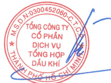
Phùng Tuấn Hà Chủ tịch Hội đồng Quản trị Ngày 27 tháng 3 năm 2026

Các thuyết minh từ trang 10 đến trang 58 là một phần cấu thành báo cáo tài chính hợp nhất này.