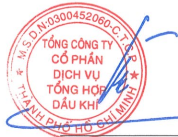
Phùng Tuấn Hà Chủ tịch Hội đồng Quản trị