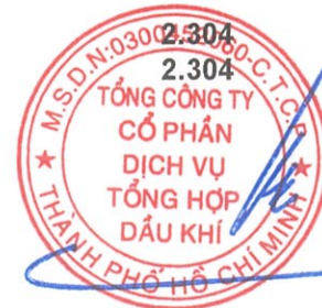
Phùng Tuấn Hà Chủ tịch Hội đồng Quản trị Ngày 27 tháng 3 năm 2026

Các thuyết minh từ trang 10 đến trang 58 là một phần cấu thành báo cáo tài chính hợp nhất này.