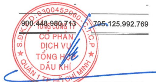
Phùng Tuấn Hà Chủ tịch HĐQT Ngày 15 tháng 3 năm 2025

Các thuyết minh từ trang 10 đến trang 55 là một phần cấu thành báo cáo tài chính riêng này.