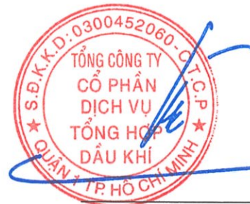
Phùng Tuấn Hà Chủ tịch HĐQT Ngày 15 tháng 3 năm 2025

Các thuyết minh từ trang 10 đến trang 55 là một phần cấu thành báo cáo tài chính riêng này.