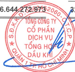
Phùng Tuấn Hà Chủ tịch HĐQT Ngày 15 tháng 3 năm 2025

Các thuyết minh từ trang 10 đến trang 55 là một phần cấu thành báo cáo tài chính riêng này.